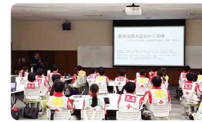
▲救護員指導者による講義