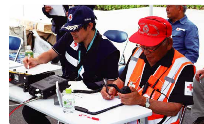
▲無線局の開設訓練