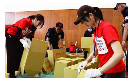
▲段ボールベッドの設営訓練