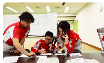
▲情報収集を行う災害対策本部要員

今後も、このような訓練や研修で得た知識と経験を災害対応に活かし、赤十字に求められる救護活動を着実に展開してまいります。