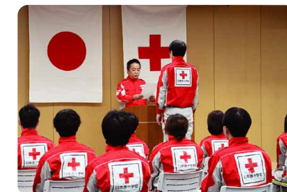
▲救護員辞令交付式