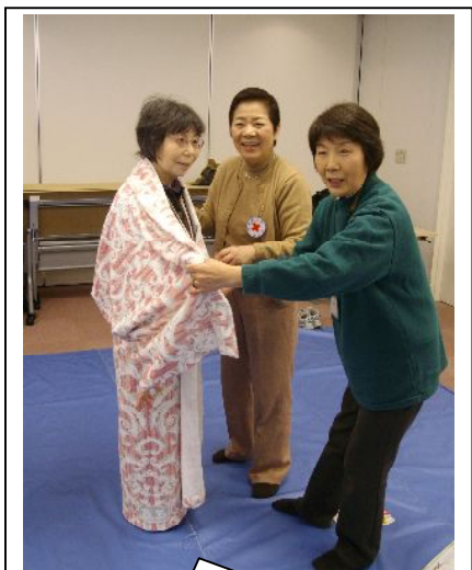
タオルケットがガウンに 早変わり

近頃、街のいたるところで目にするAEDですが、いざという時どのように使うのかを、実際に研修を受けてみて身近なものになったと思います。肺に息を吹き込むことの難しさ、心臓マッサージに力があること、そしてAEDの使い方、どれをとっても救急車が来るまでの大切な数分間です。人がしている時は何をすれば良いのか判断できるのに、いざ自分の番になると訓練といえども慌てて何からしてよいのやら戸惑う始末でした。先ず落ち着く事、近くの人に呼びかけ手伝ってもらう事等々反省することばかりでした。