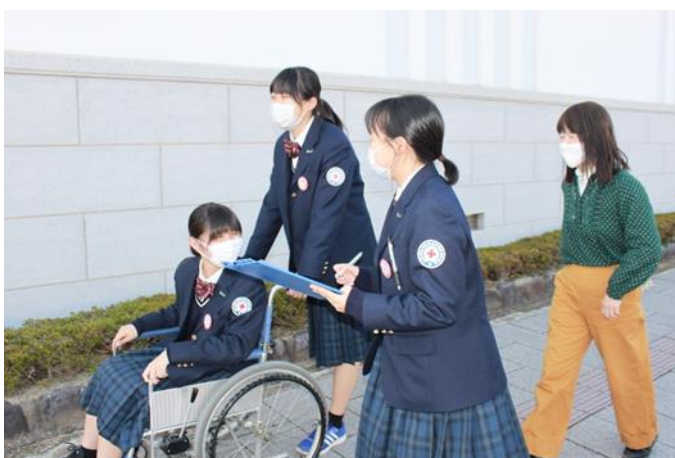
青少年赤十字研究推進校の活動

京都府・大阪府・兵庫県の高校生と指導者が、マレーシアの赤新月社青少年赤十字メンバーとの文化交流やディスカッション等を通じて国際理解・親善を図る。