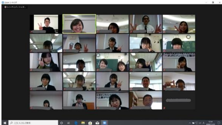
青少年赤十字オンラインイベント