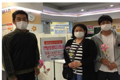
母の日キャンペーン (兵庫県花卉協会)