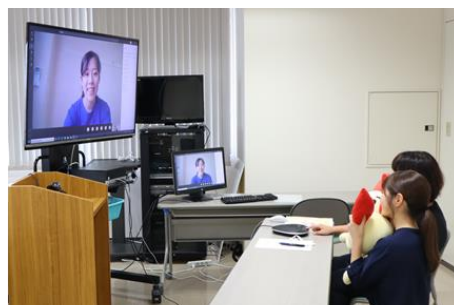
オンラインセミナー (関学応援団)