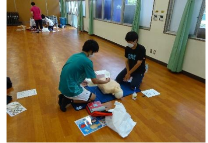
赤十字救急法講習

水上安全法では、安全で確実な泳ぎの基本を身につけ、事故防止や溺者を救助する方法を積極的に普及していく。