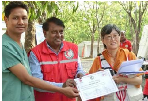
Bangladesh南部避難民保健医療支援事業に取り組む高原看護師（写真右、姫路赤十字病院）