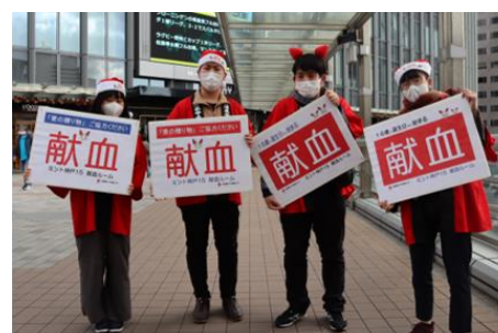
クリスマスキャンペーン (兵庫県学生献血推進協議会)