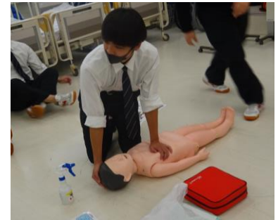
赤十字幼児安全法講習

また、健やかな高齢期をむかえるために、病気の予防や健康維持の大切さを学ぶ。さらに、家庭や地域で高齢者を介護する時に役立つ知識と技術を身につけ、自分のため、家族のため、地域のために役立つ赤十字健康生活支援講習を普及する。