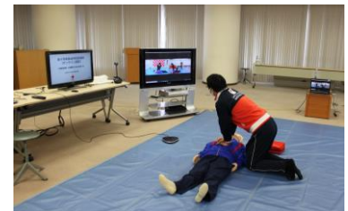
赤十字オンライン講習

コロナ禍に伴い開始したオンライン講習の充実を図るとともに、日本赤十字社をはじめ各国赤十字社・赤新月社が毎年、救急法の普及活動を展開している9月第2土曜日の「World First Aid Day (世界救急法の日)」に関連したオンラインでのイベント実施を企画し、より多くの県民の皆さまに赤十字救急法を普及し、健康と安全についての知識と技術を習得していただくとともに赤十字への関心を深めていただけるよう努める。