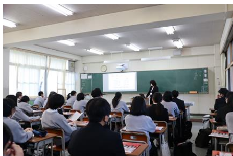
献血セミナー (西宮今津高校)