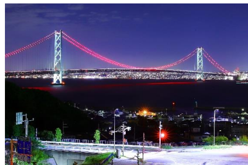
世界赤十字デー 明石海峡大橋レッドライトアップ

また、若年層が頻繁に利用する YouTube やインスタグラム等の SNS を活用した情報発信を強化し、赤十字活動に興味・関心を持っていただけるよう広報を展開する。