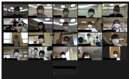
オンライン学習会

参加者からは「まだまだコロナが終息しない中、懸命に活動されている医療従事者へ少しでも応援になれば嬉しい」などの感想がありました。