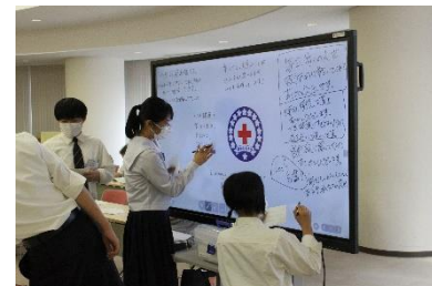
メッセージボード作成