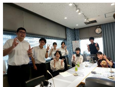
兵庫県立龍野高等学校による ラジオ関西番組出演