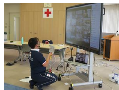
オンライン講習(幼児安全法)

また、住み慣れた地域で自分らしい暮らしを続けることができるよう、自助・互助・共助・公助を踏まえて健康の維持・増進と高齢期の自立を促す方法を普及する。