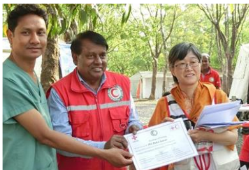
バングラデシュ南部避難民保健医療支援事業に取り組む高原看護師（写真右、姫路赤十字病院）