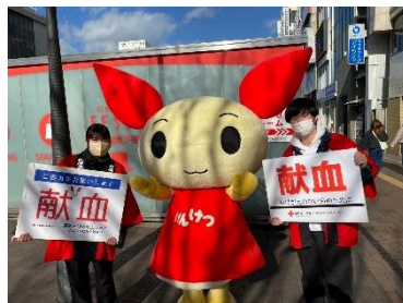
全国学生クリスマス献血キャンペーン (兵庫県学生献血推進協議会)