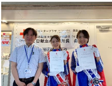
宝塚市観光大使「サファイア」による 1 日献血ルーム所長 委嘱